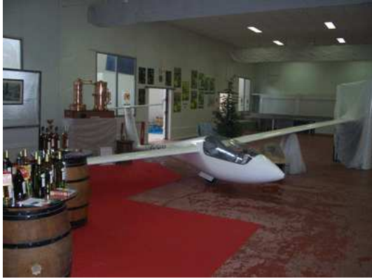
Planeur - Centre Vélivole