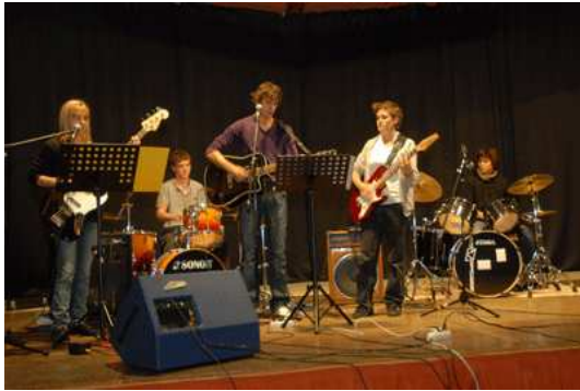
Concert de l'Ecole de Musique