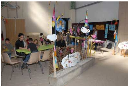
Atelier Ca Boom