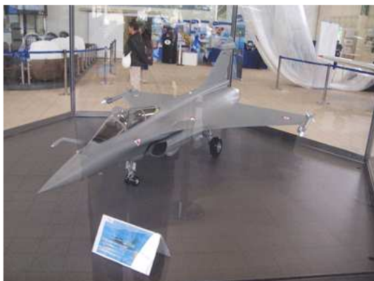
Maquette Armée de l'Air