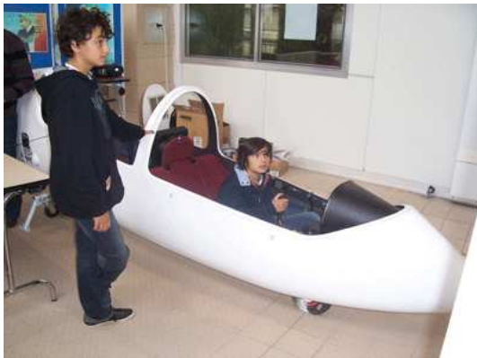
Simulateur de vol – Centre Vélivole