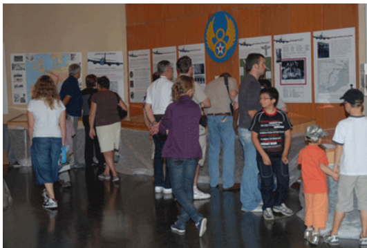
Le Crash du B17 en Gascogne