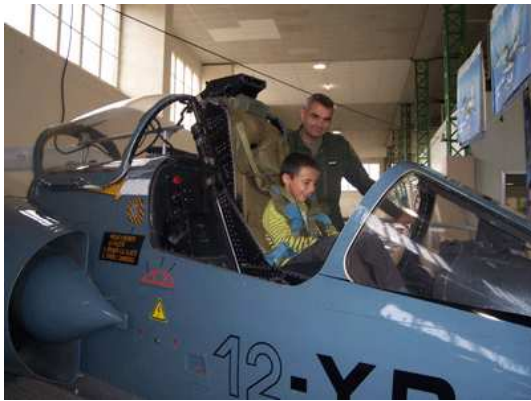
Simulateur Armée de l'Air – F1 siège éjectable