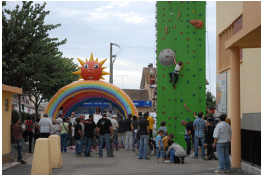
Tout pour l'animation