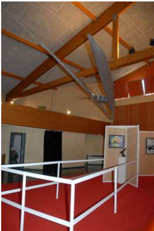
Les Peintres de l'Air