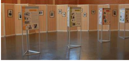
Les Femmes et les Métiers – Air France