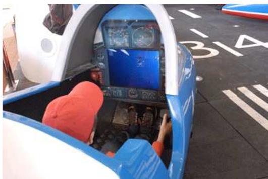
Simulateur Armée de l'Air – Patrouille de France