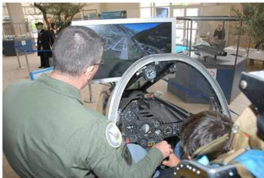
Simulateur de vol Armée de l'Air – F1