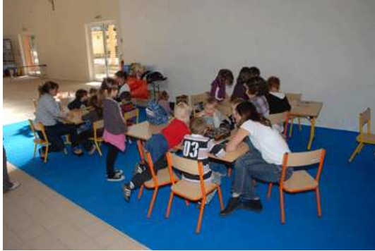
Atelier Mme Lecomte