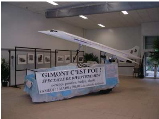
Lauréat du concours de chars