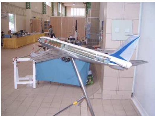
Maquettes Air France