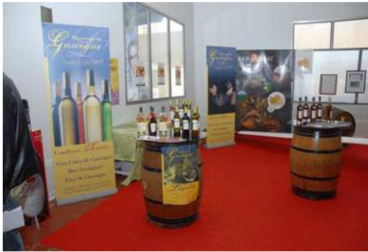
Le domaine de Laguille